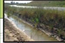
Création de zones humides