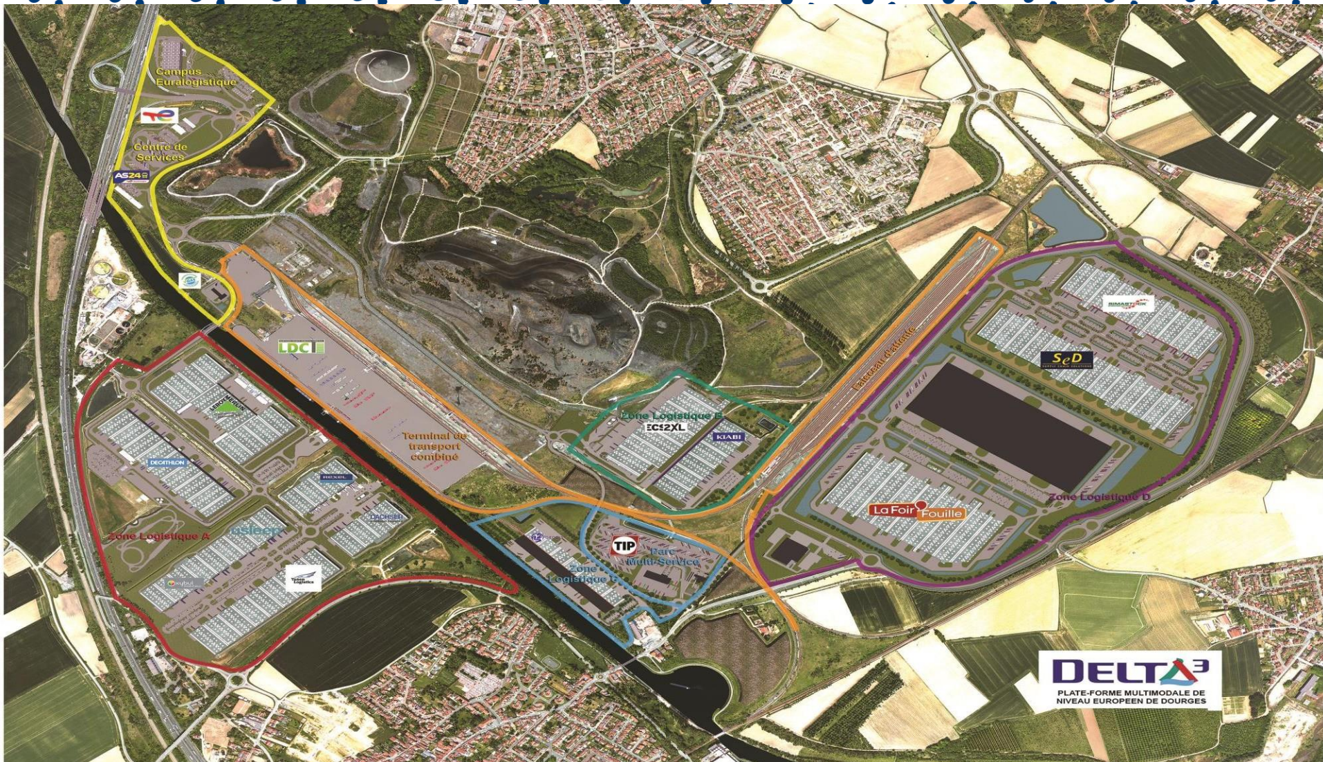
PLATE-FORME MULTIMODALE ET LOGISTIQUE DOURGES