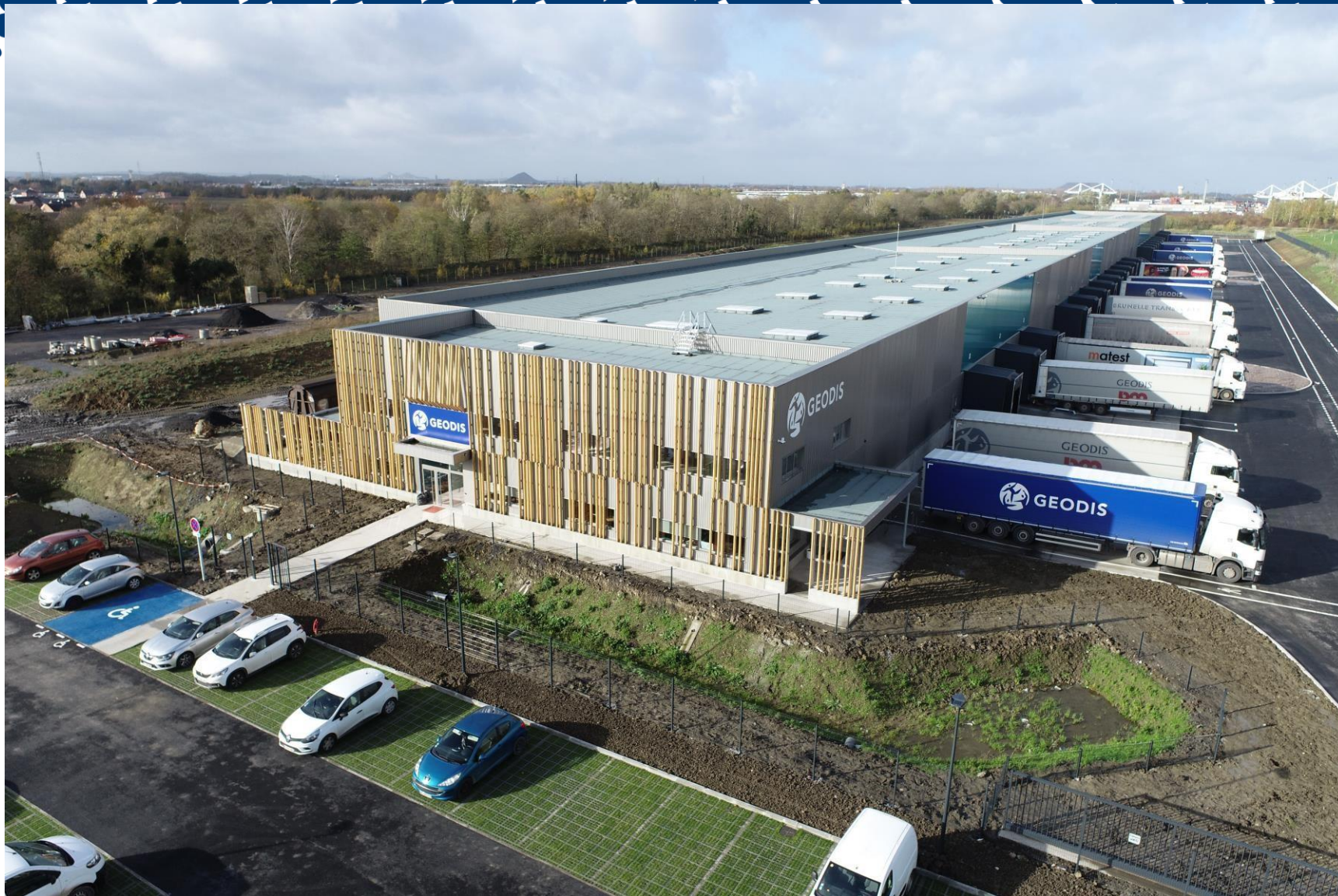
PLATE-FORME MULTIMODALE ET LOGISTIQUE DOURGES