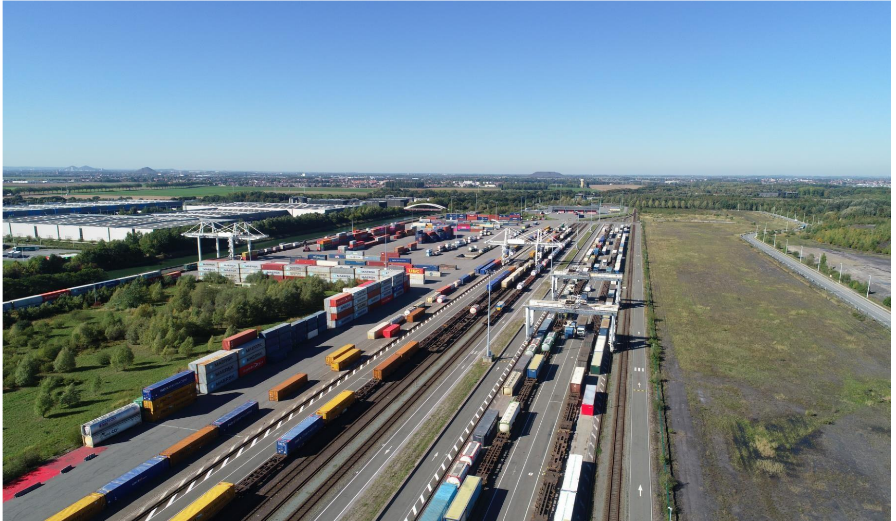
PLATE-FORME MULTIMODALE ET LOGISTIQUE DOURGES