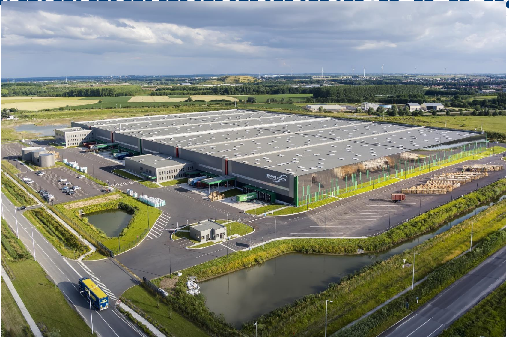
PLATE-FORME MULTIMODALE ET LOGISTIQUE DOURGES