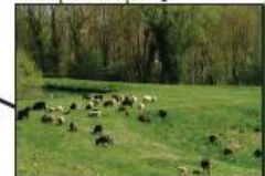
Mise en place d'éco-pâturage