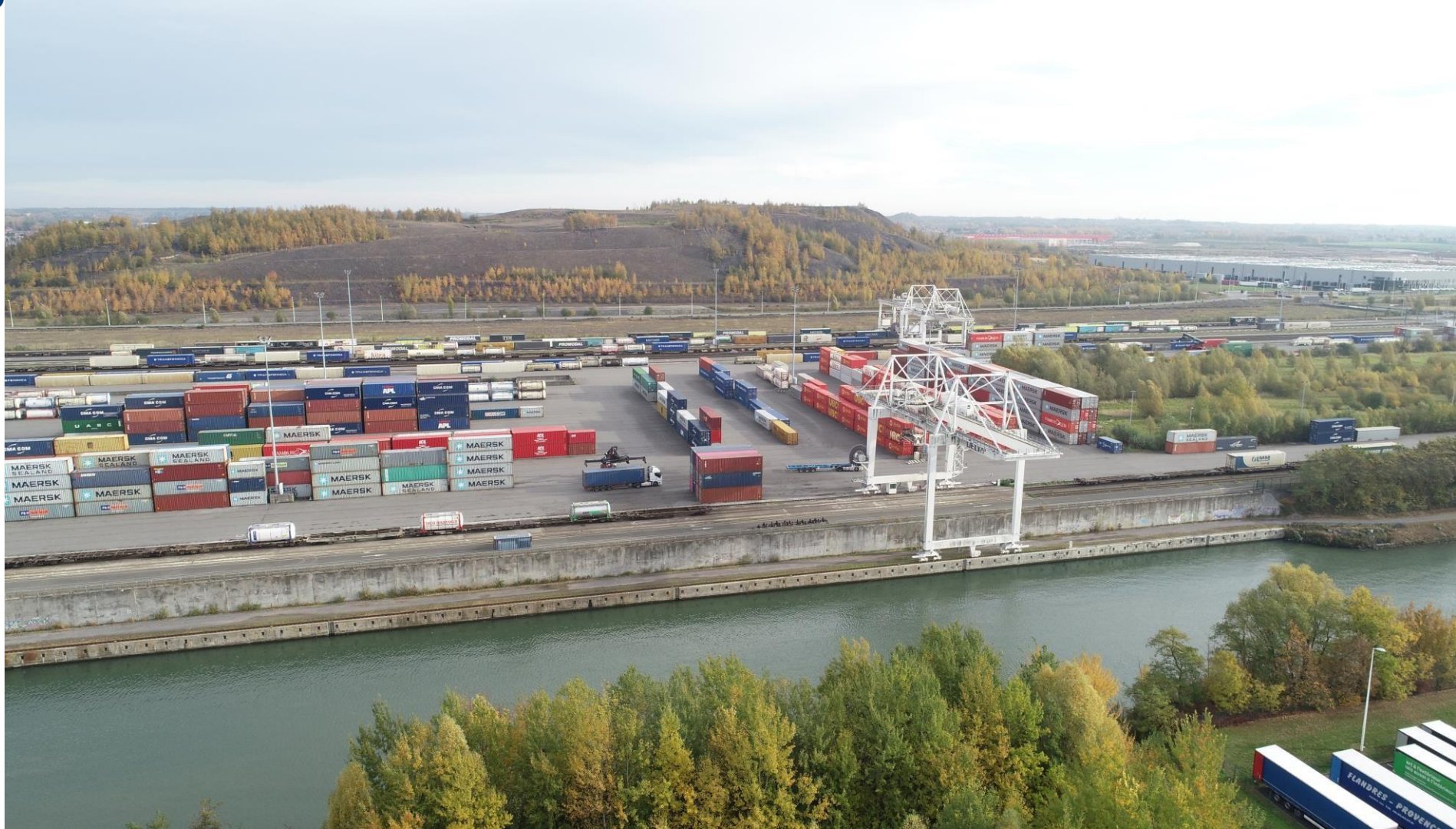
PLATE-FORME MULTIMODALE ET LOGISTIQUE DOURGES