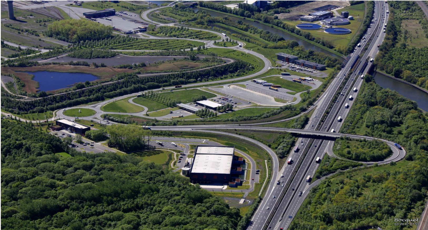
PLATE-FORME MULTIMODALE ET LOGISTIQUE DOURGES