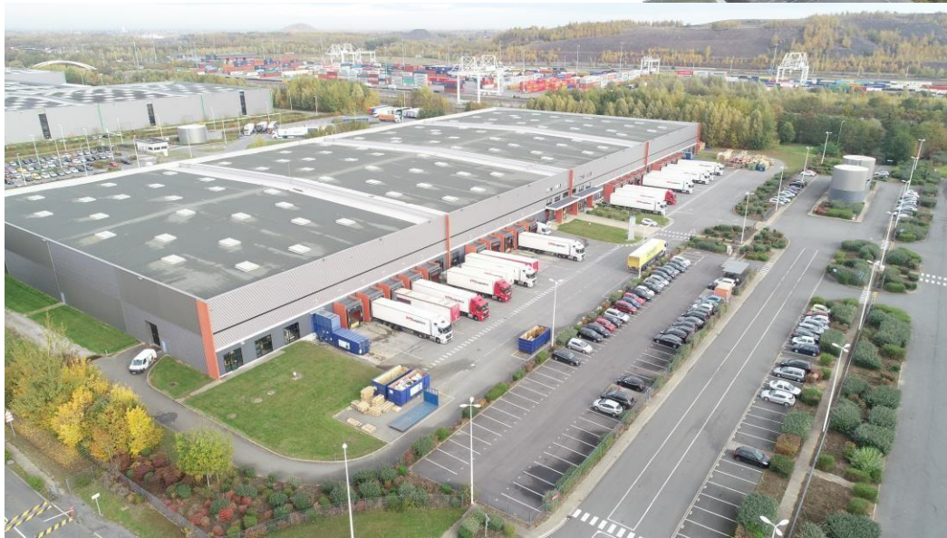
PLATE-FORME MULTIMODALE ET LOGISTIQUE DOURGES