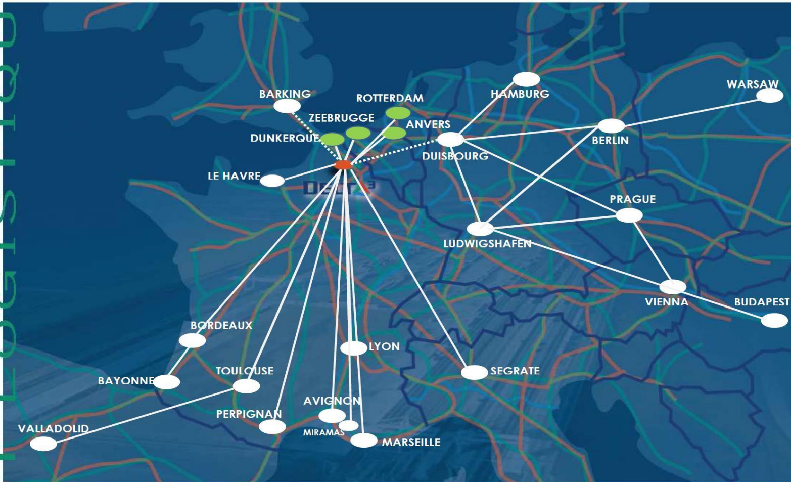
PLATE-FORME MULTIMODALE ET LOGISTIQUE DOURGES