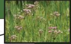
Déplacement de l'Ananas aquatique