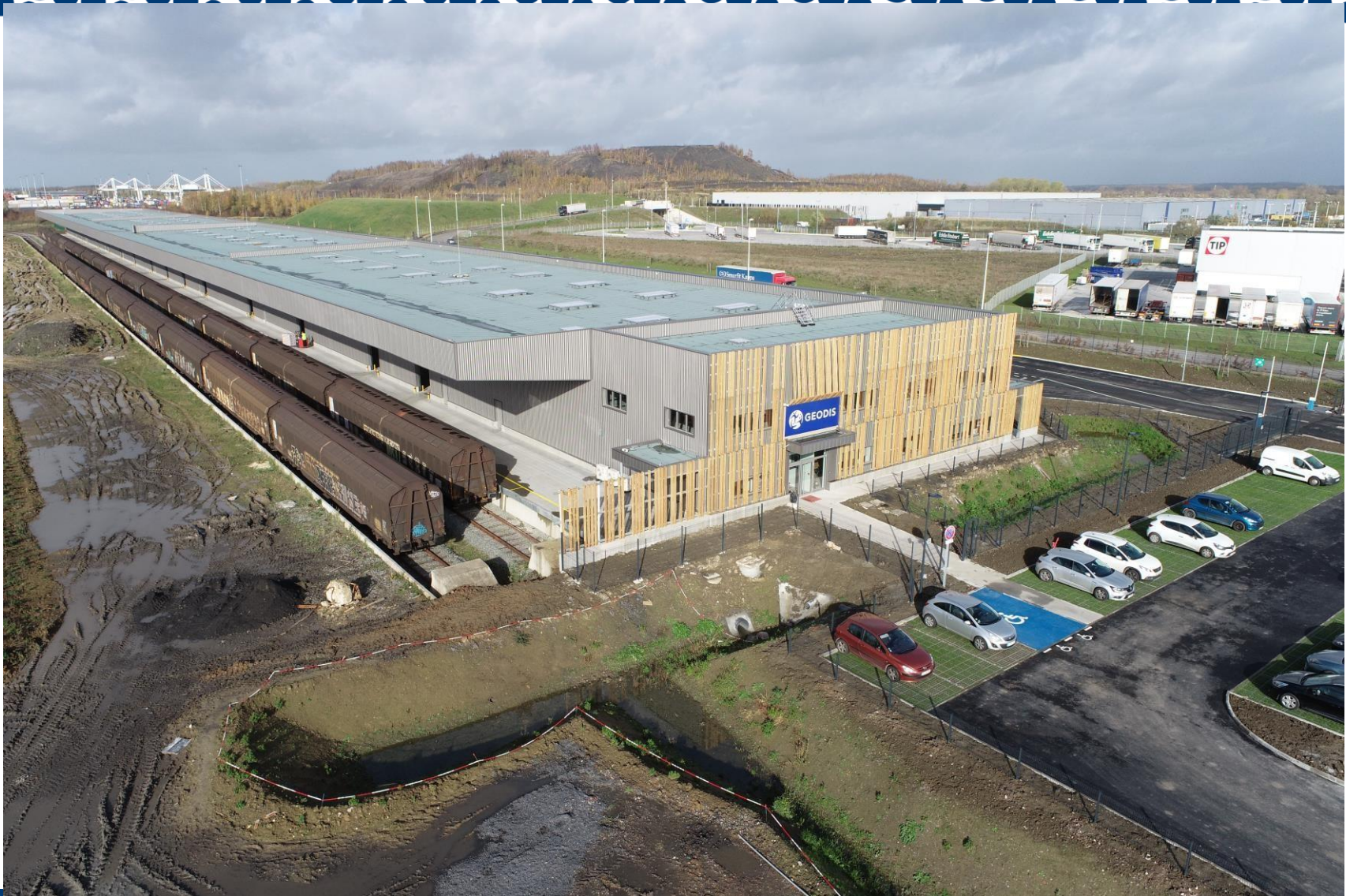
PLATE-FORME MULTIMODALE ET LOGISTIQUE DOURGES