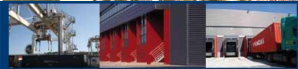
PLATE-FORME MULTIMODALE ET LOGISTIQUE DOURGES

DELTA 3 PLATE-FORME MULTIMODALE DE NIVEAU EUROPEEN DE DOURGES