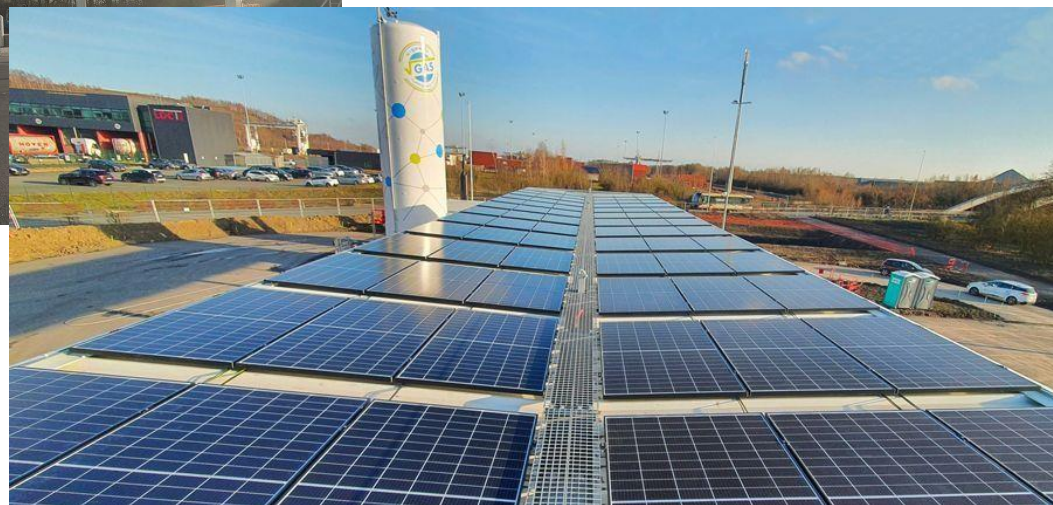
PLATE-FORME MULTIMODALE ET LOGISTIQUE DOURGES