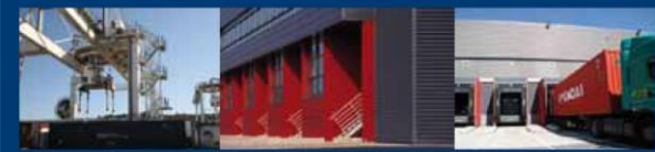
PLATE-FORME MULTIMODALE ET LOGISTIQUE DOURGES