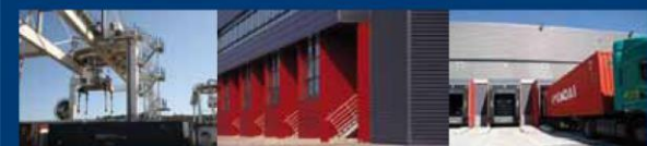
PLATE-FORME MULTIMODALE ET LOGISTIQUE DOURGES

PRELABLE AU LANCEMENT D'UNE PROCEDURE DE DÉLÉGATION DE SERVICE PUBLIC