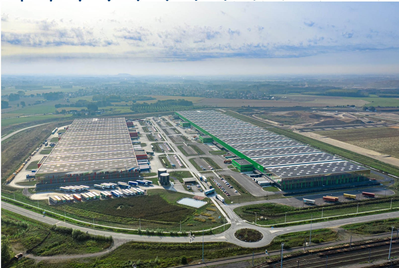
PLATE-FORME MULTIMODALE ET LOGISTIQUE DOURGES