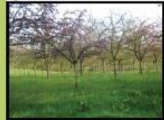
Création d'un verger composé de variétés régionales d'arbres fruitiers